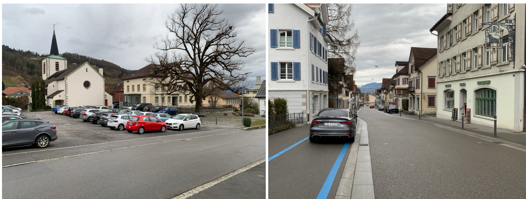
Abb. 2: Parkplatz „Lindenhausparkplatz“ (ID 07a), links / Parkfelder entlang der Neugass (ID 05), rechts

Die Parkgebühren der Parkieranlagen im Zentrum sind aufeinander abzustimmen. Es wird jedoch davon abgesehen, sämtliche Anlagen monetär zu bewirtschaften. Damit kann auf die ortsspezifischen Bedürfnisse eingegangen werden. Um einen gesteigerten Gemeingebrauch zu unterbinden, sollen Parkieranlagen ohne Parkgebühren zeitlich bewirtschaftet werden – entweder mit einer Höchstparkierdauer (z. B. max. 2h) oder zeitlichen Beschränkungen z. B. Blaue Zone). Somit ist jede Parkieranlage aufgrund der vorherrschenden Nutzergruppe einzeln zu beurteilen.