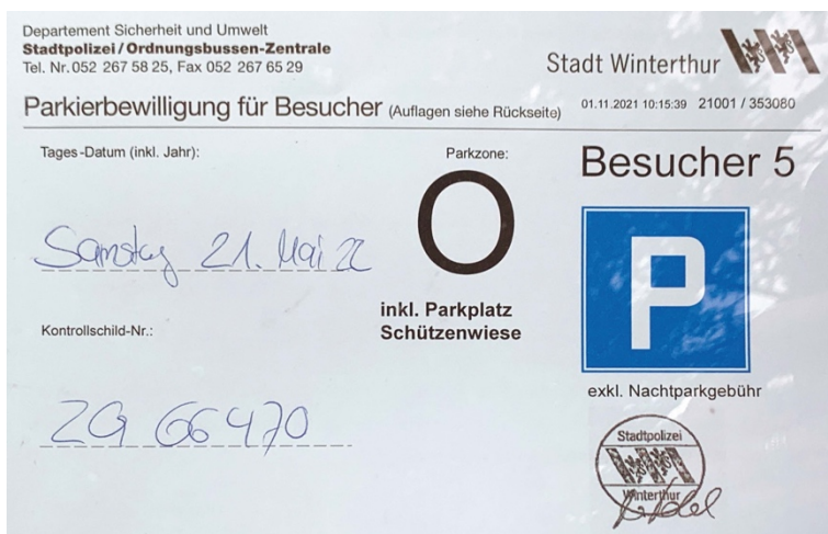
Abb. 3: Beispiel Besucher-Parkkarte Stadt Winterthur

Für Anwohnende und Besucher*innen können ebenfalls Dauerparkkarten herausgegeben werden. Die Berechtigung für den Bezug soll jedoch anhand noch durch den Gemeinderat zu definierende Kriterien geprüft werden, wie beispielsweise der Nachweis, dass im Umkreis von 100 m kein privater Parkplatz mietbar ist. Der Preis von Dauerparkkarten wird in einem vom Gemeinderat zu erlassenden Gebührentarif festgelegt.