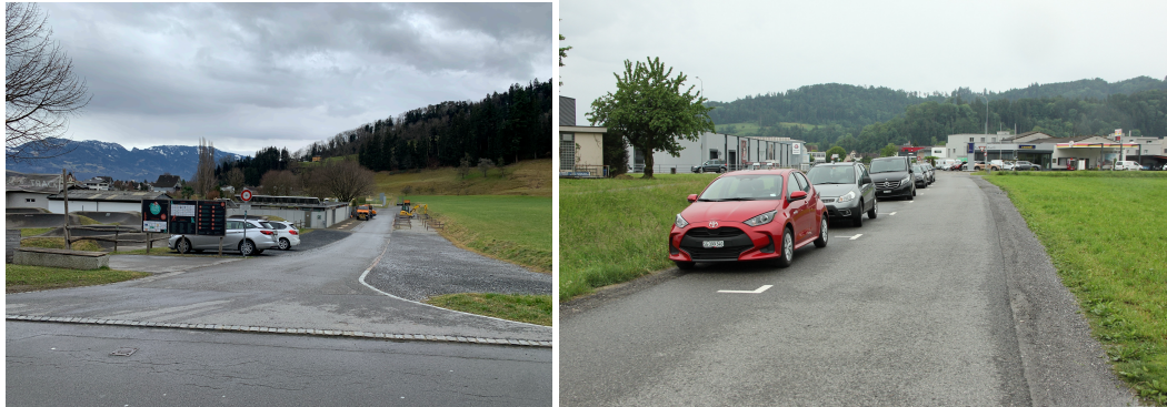
Abb. 3: Parkplatz «Schwimmbad» (ID 14), links / Parkplatz «Littenbachstrasse» (ID 13), rechts

von einzelnen Parkfeldern auf der Hinterburgstrasse zu prüfen. Diese Parkplätze sind gleich zu bewirtschaften wie die Schwimmbadparkplätze (ID 14).